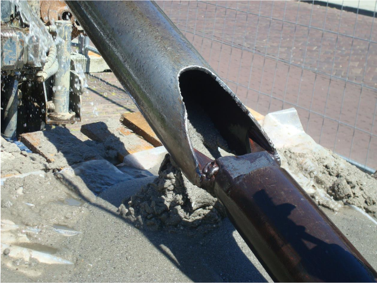
Het legen van een puls